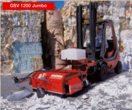
GSV 1200 Jumbo