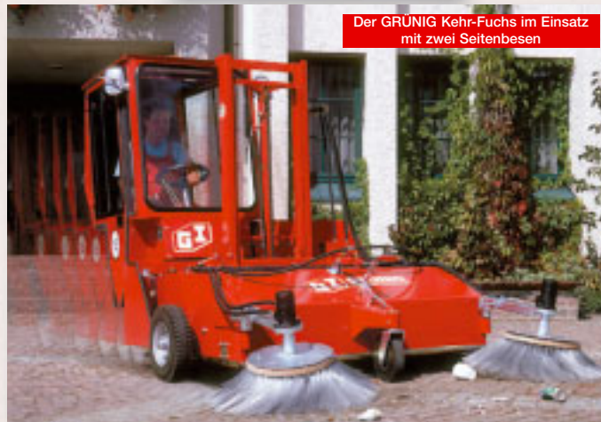
Der GRÜNIG Kehr-Fuchs im Einsatz mit zwei Seitenbesen