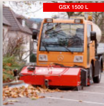
GSX 1500 L