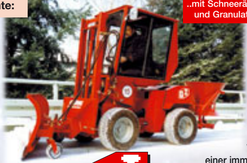
..mit Schneeräumschild und Granulatstreuer