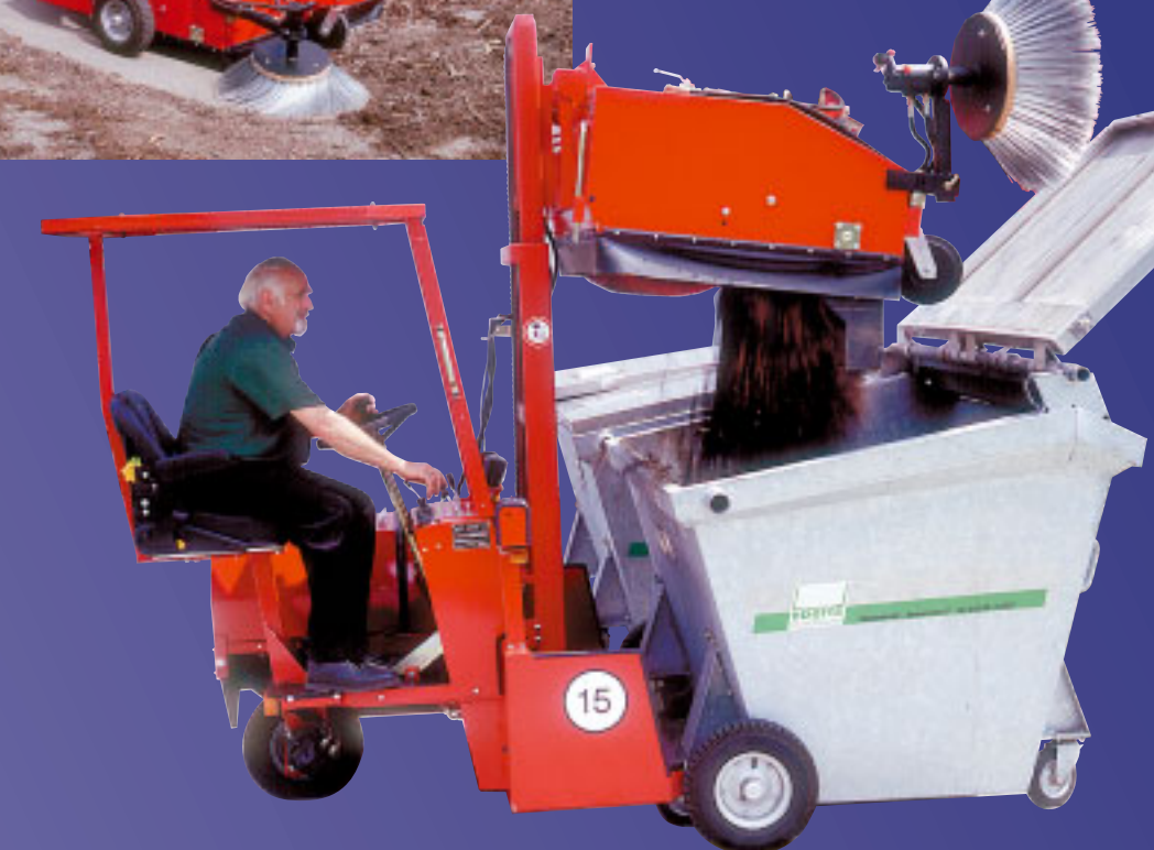
Hochentleerung in Container