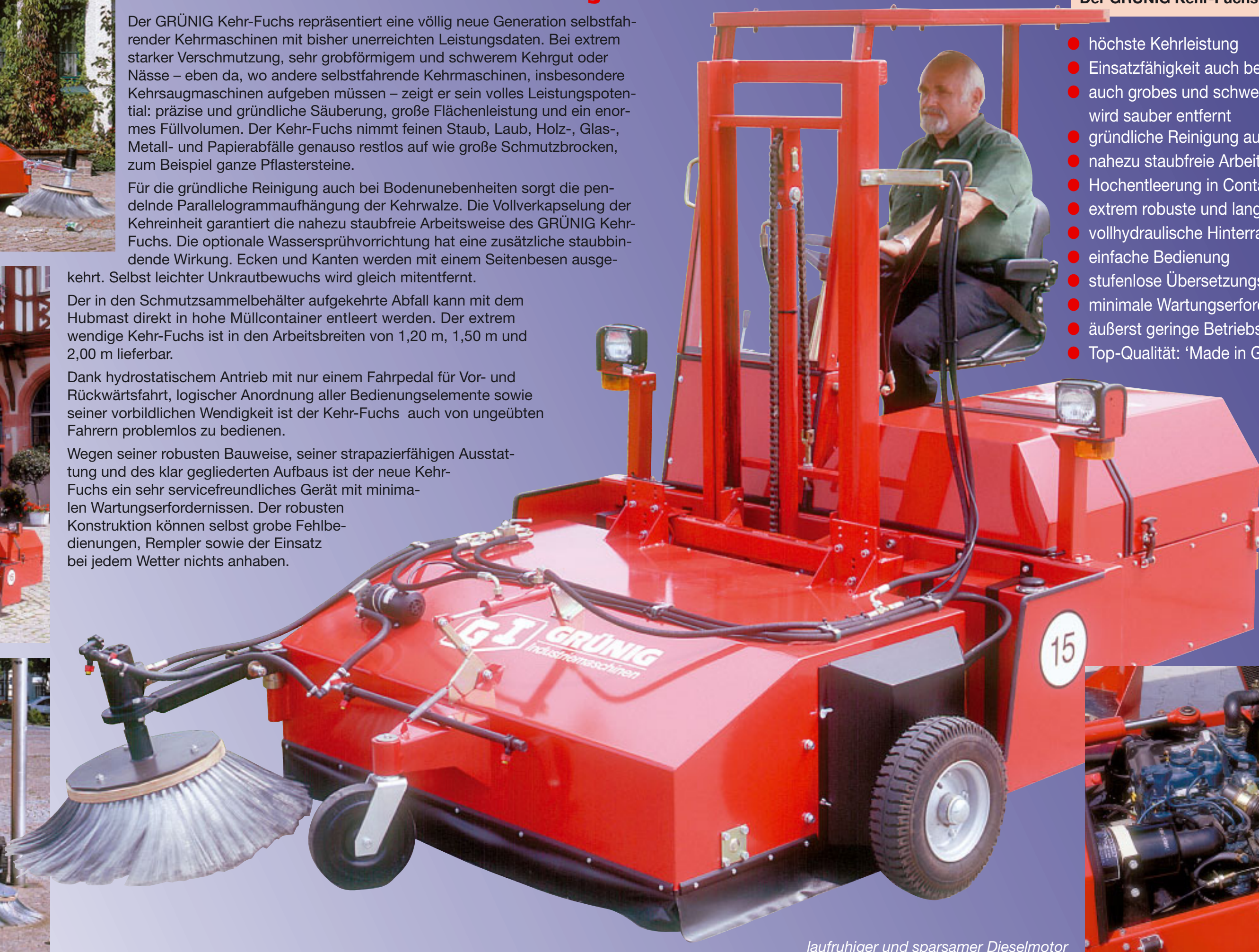
laufruhiger und sparsamer Dieselmotor