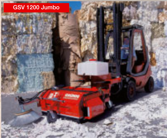
GSV 1200 Jumbo