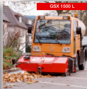
GSX 1500 L