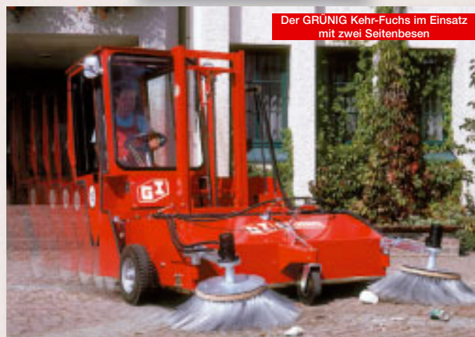
Der GRÜNIG Kehr-Fuchs im Einsatz mit zwei Seitenbesen